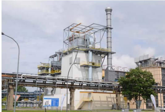
Мельница типа LM 35.3 D на электростанции Schwarze Pumpe в Германии

Многолетнее успешное сотрудничество с компанией Sinoma International Engineering позволило LOESCHE вновь получить контракт